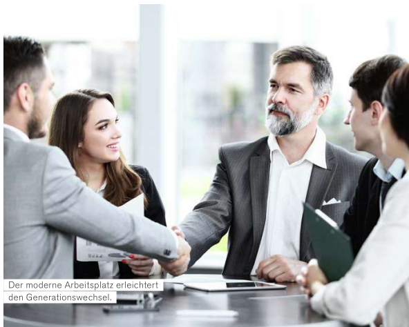
Der moderne Arbeitsplatz erleichtert den Generationswechsel.

Ein Wechsel in der Belegschaft ist unvermeidlich, besonders dann, wenn Mitarbeiter in den Ruhestand gehen und die nächste Generation nachrückt. Ein Generationswechsel ist jedoch nicht immer einfach, da langjährige Mitarbeiter oftmals über wertvolles Wissen und Erfahrungen verfügen, welche nicht schriftlich an einem Ort gesammelt wurden. Eine cloudbasierte Lösung ermöglicht den Zugriff auf Wissen, immer und überall. Jüngere Mitarbeiter sind oft mit den neuesten Technologien vertraut und können älteren Mitarbeitern weiterhelfen. Mitarbeiter, die viele Jahre im Betrieb tätig sind, verfügen aufgrund